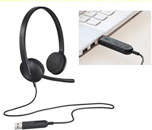
ヘッドセット（USB 接続式）

※WEB カメラ・ヘッドセット等については個々の機器の違いや PC の違い、接続環境などがあることから事務局にお問い合わせいただいても お答えできない 為、ご自身で参加前に ZOOM が使用できる様にご自身で セッティング をよろしく お願いいたします 。当日にご連絡いただいても対応が出来ない